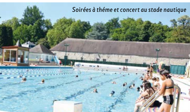
Soirées à thème et concert au stade nautique