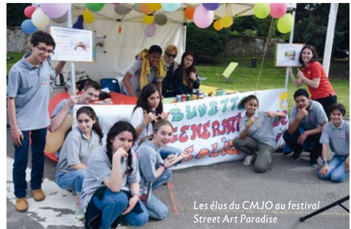
Les élus du CMJO au festival Street Art Paradise