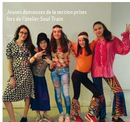
Jeunes danseuses de la section prises lors de l'atelier Soul Train

La section sportive danse du collège Alain-Fournier se porte toujours bien. Forte de ses 52 élèves, elle participe aux rencontres du sport scolaire, aux événements dansés organisés par le service culture de la mairie et se déplace sur des ateliers et spectacles. Cette année, grâce au soutien de la mairie, elle a accueilli les rencontres scolaires académiques dans le gymnase Marie-Thérèse Eyquem. Les jeunes organisateurs ont été remerciés pour la qualité de l'accueil qu'ils ont réservé à leurs camarades des autres départements (78, 92 et 95). Vous pourrez voir ces élèves danser lors du spectacle de fin d'année le vendredi 16 juin à 20h30 à l'opéra de Massy.