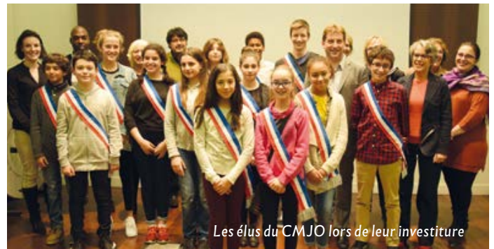
Les élus du CMJO lors de leur investiture